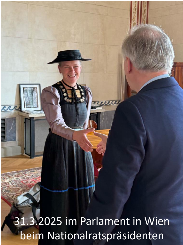
31.3.2025 im Parlament in Wien beim Nationalratspräsidenten