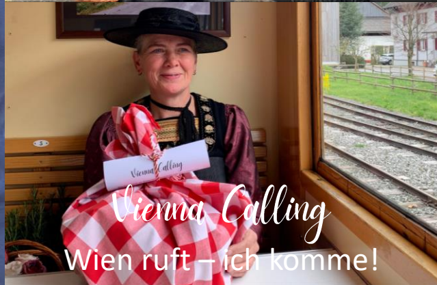
Vienna Calling Wien ruft – ich komme!